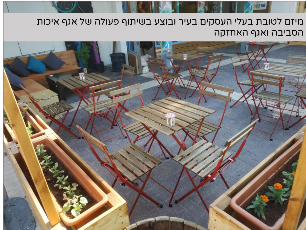
מיזם לטובת בעלי העסקים בעיר ובוצע בשיתוף פעולה של אגף איכות הסביבה ואגף האחזקה