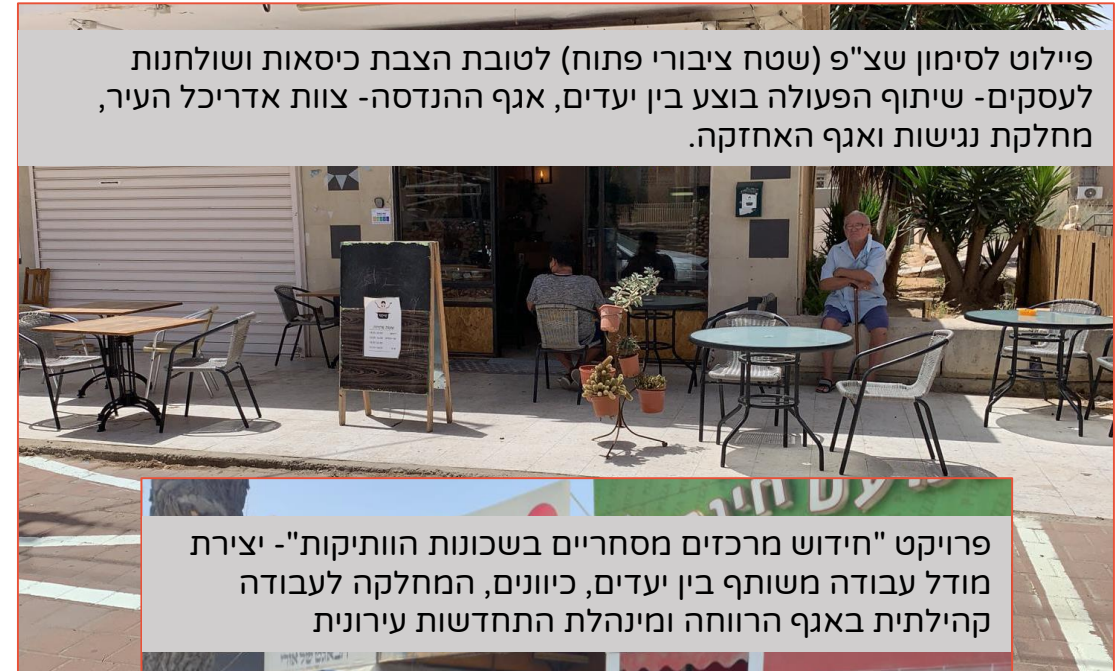
פיילוט לסימון שצ"פ (שטח ציבורי פתוח) לטובת הצבת כיסאות ושולחנות לעסקים- שיתוף הפעולה בוצע בין יעדים, אגף ההנדסה- צוות אדריכל העיר, מחלקת נגישות ואגף האחזקה.